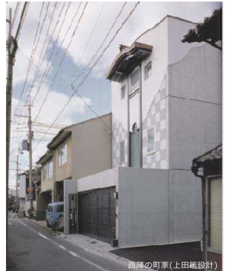
西陣の町家(上田篤設計)