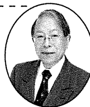
小和田 哲男 氏

NHK『歴史秘話ヒストリア』や教育テレビ『NHK高校講座 日本史』などでの解説を務める。また、NHK大河ドラマ『秀吉』(1996年)『功名が辻』(2006年)『天地人』(2009年)『江～姫たちの戦国～』(2011年)『軍師官兵衛』(2014年)の時代考証を担当している。